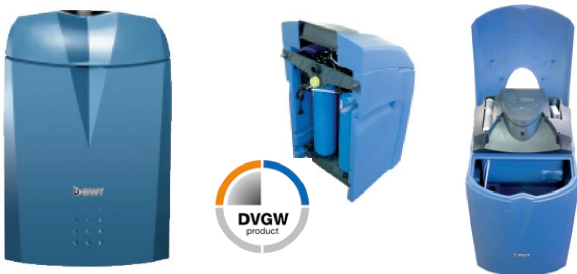
1. ábra – AQA perla Delux