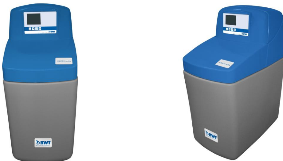
1. ábra –BWT Aquadial softlife vízlágyító