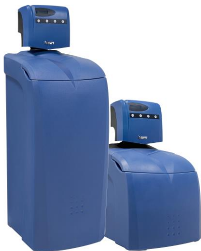
1. ábra – QA perla BIO termékcsalád