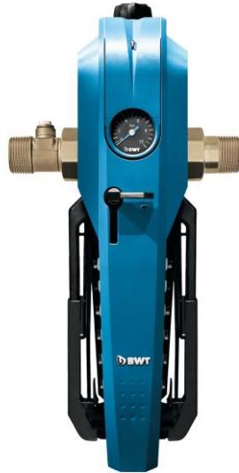
BWT E1 higiénikus szűrő