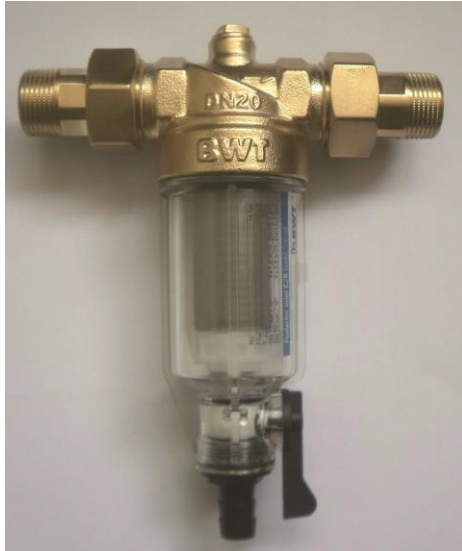
Protector Mini CR – hidegvizes szűrő