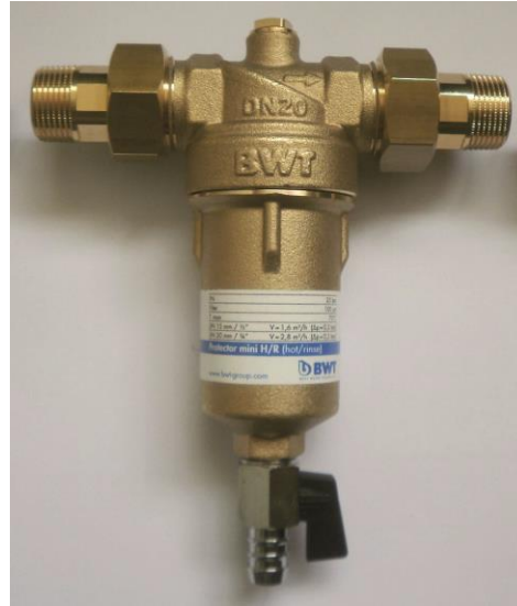
Protector Mini HR – melegvizes szűrő